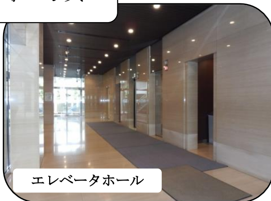
エレベータホール