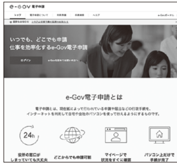
e-GOV電子申請トップページ

e-GOV電子申請は、各省庁の様々な行政手続きを、インターネットでできるシステムです。