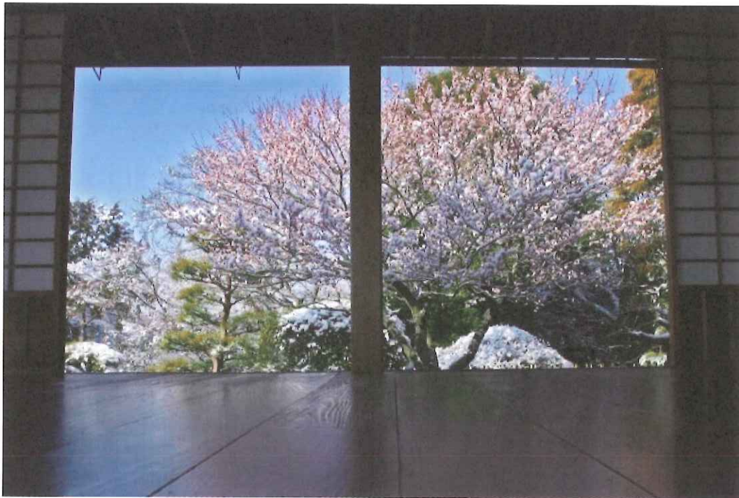
偕楽園～好文亭内（水戸市）