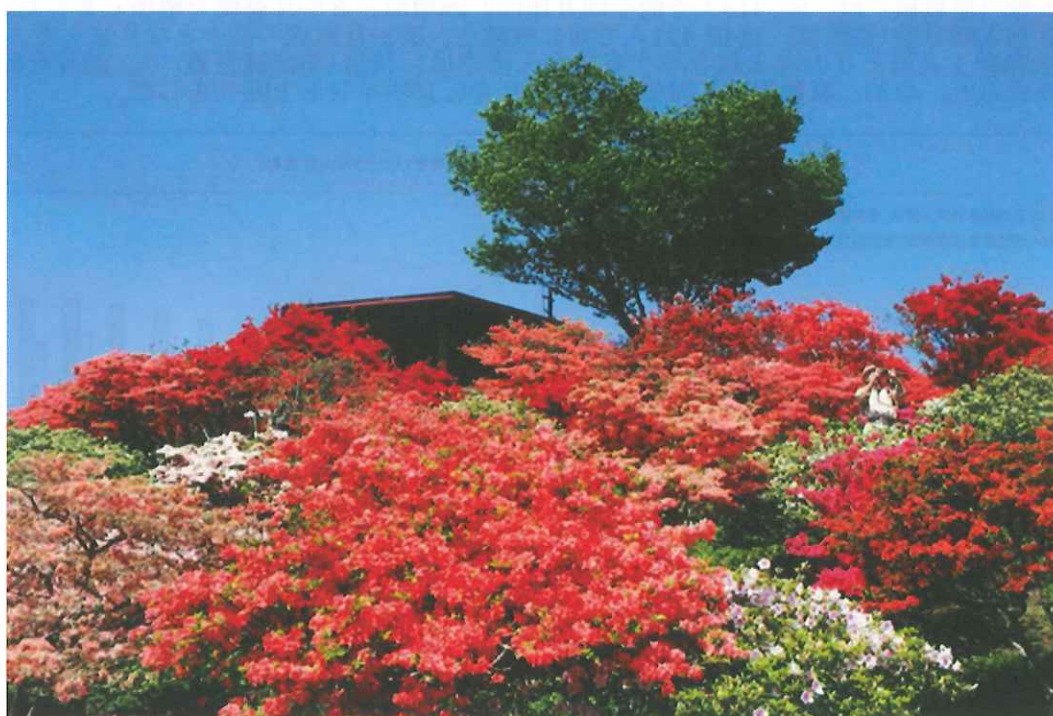
「笠間つつじ公園」(笠間市)(観光いばらき「写真ひろば」より)