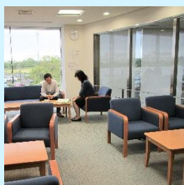
休憩可能なフリースペース