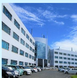
ひたちなかテクノセンター

事務職にかかせないOA操作についてOS基本操作からOffice系ソフトまでを体系的に学びMOS試験の合格を目指します。さらに事務職基礎知識(総務事務と社会保険の基礎)及び、Excelに関しては、基礎からマクロ・ExcelVBA(Excelプログラミング基礎)までを学習し「OA事務エキスパート」人材を目指します。