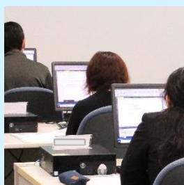
PCデスクは1人1台用意