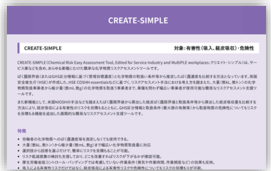
「化学物質のリスクアセスメント実施支援」