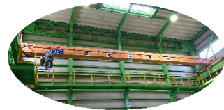
床上操作式クレーン