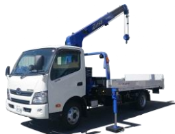
小型移動式クレーン