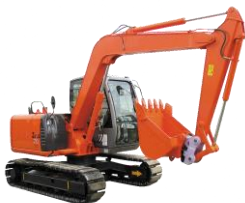
車両系建設機械(整地等)