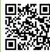
この訓練の補足資料

さらに、就職支援（応募書類作成、コミュニケーション）により、再就職に向けてスキルアップを目指します。