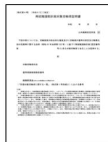
再就職援助計画 対象労働者証明書