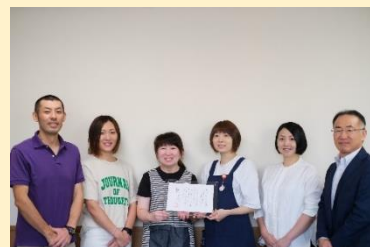
平鹿悠真会の皆様

の2つを育児支援制度のポリシーとして掲げている。妊娠や育児中の職員も他職員と同様の活躍を期待し育成していくために、仕事と育児の両立支援に重点をおき育児支援制度を進めていく。