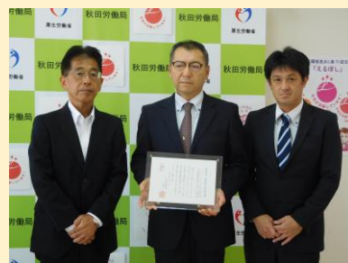
認定通知書交付式の様子

共に働く人々が、個人の生活環境や価値観に違いが有ることを理解し、お互いを尊重する企業風土の醸成に取り組んでいます。その上で、一人ひとりの個性と能力を存分に発揮できる働き方の選択肢の一つでも増やしていきたいと考えています。