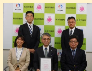
認定通知書交付式の様子

在宅勤務（テレワーク）を平成31年4月に制度化し、育児や介護などの事情により通常勤務が困難な社員が退職することなく継続勤務ができるような体制を整備。利用実績女性1名（育児休業からの復職後、遠距離通勤に対応するため）。