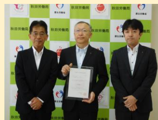
認定通知書交付式の様子