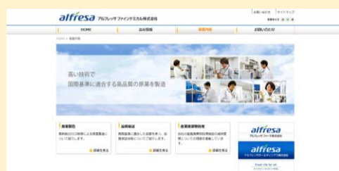
ホームページの画面